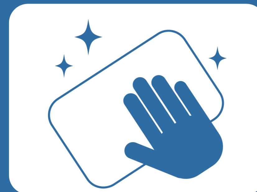
定期的な清掃・消毒