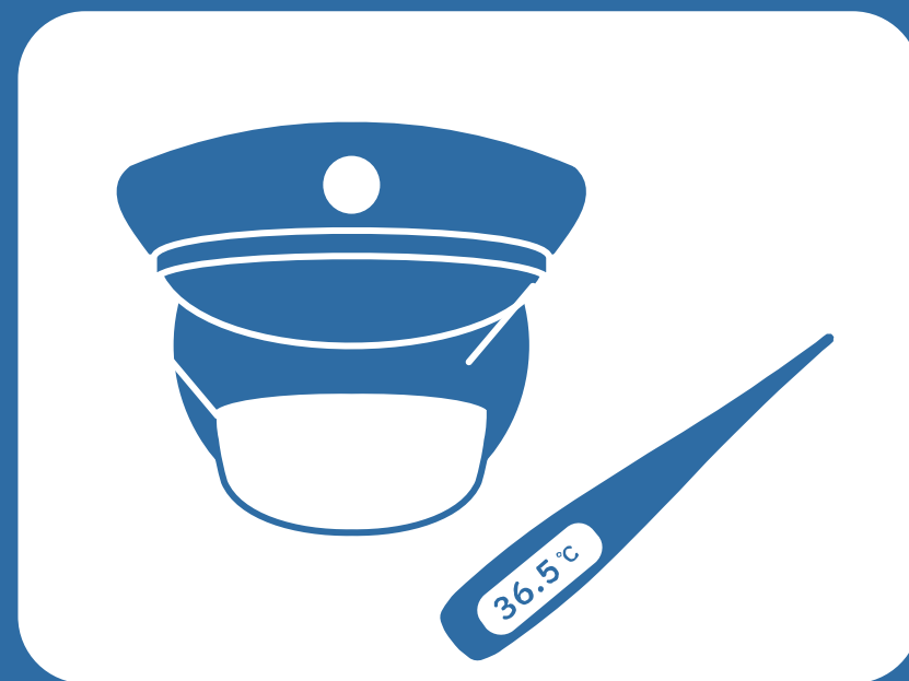
マスクの着用・健康管理