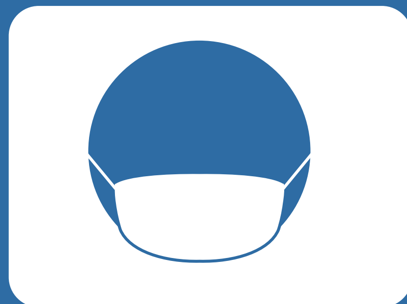
マスクの着用を お願いします