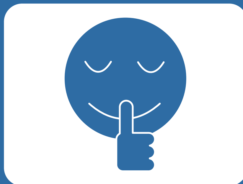
会話を控えるよう お願いします